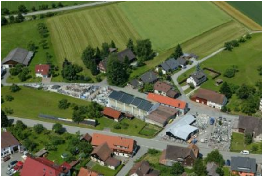
Firmengelände von oben